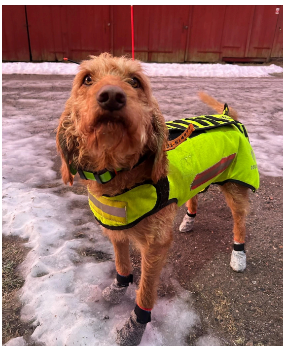
Bildkälla: Elisabeth Forsblom, Stella

Vi har nästan alltid tassor på när vi jagar och det är snö. Det är inte bara skaren som ställer till och ger en massa skrapsår utan ofta uppstår det små sår mellan tårna liksom och runt klorna. Vi har upptäckt att det skyddar bra med tassorna och att skadorna har minskat.