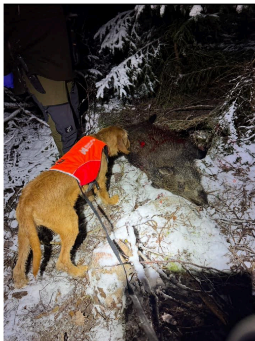
Gaston, eftersök vildsvin

Fyll på med vätskeersättning och energi under dagen, t.ex. energipasta eller energikex (finns att köpa i små smidiga förpackningar). Vid kalla jaktdagar kan man med fördel ta med en termos med ljummen vätskeersättning i jaktvästen.